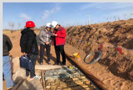
11月4日，一八五公司地质环境工程勘察院开展冬季安全检查工作。