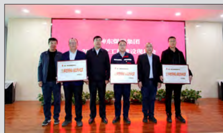
10月14日，天地公司在国家能源集团神东煤炭集团有限公司2020年度工程建设现场会上被授予神东集团2019年信用等级A级优秀承包商。