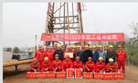
10月29日，一九四公司在眉县地热试验井项目举办了一线职工技术比武活动。